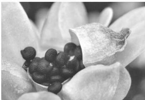
بقلة الحَمقاء (خُرْفَه، بقلة المباركة، بقلة الزهراء، بقلة لینه)(Portulaca oleracea : purslane)

شکل ۴- درج تصاویر گیاهان دارویی و ابزارهای پزشکی نیاکان در نسخه الکترونیک