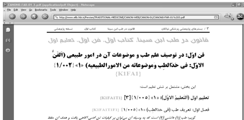
شکل ۵- ورود به منبع مورد نظر با کلیک بر روی کد مورد بحث (سایت اینترنتی وزارت بهداشت)

زیرعنوان مشابهی است که باعث تسهیل ارتباط نسخ مختلف قانون، اعم از انگلیسی، فارسی و عربی می‌گردد و بدینوسیله به آسانی میتوان عناوین و مطالب مندرج در هر نسخه را با نسخه‌های دیگر نیز مقابله و مقایسه کرد. مثلا کد KIFAITIF1 در کلیه نسخه‌ها از راست به چپ به معنی فصل اول از تعلیم اول از فن اول از کتاب اول میباشد که در رفرنس نویسی الکترونیک و پیوند مقالات و کتب الکترونیک به این منابع در سایت وزارت بهداشت، کارایی بسیار زیادی خواهد داشت و علاوه برآن در صورتیکه رفرنس نویسی مقاله به گونه‌ای باشد که چنین کدی در انتهای یکی از منابع مقاله درج شود کلیک چپ موس بر روی کد مورد اشاره باعث ظاهر شدن منبع مورد استفاده خواهد گردید (شکل ۵).